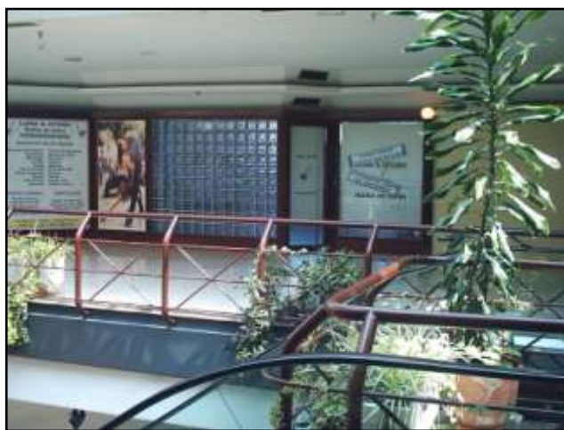
Fachada principal de acceso a la Escuela

Las clases generales de baile que se imparten mantienen una estructura de escuela.